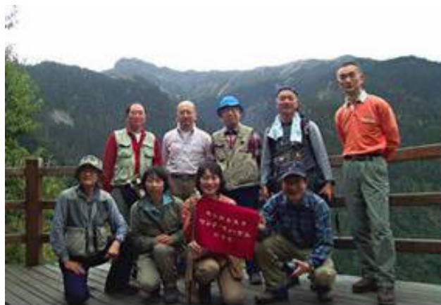
登頂を果たした玉山をバックに

玉山は台湾最高峰で台湾人にとって一度は登りたい山になっており、日本人にとっての富士山と同じです。われわれが登った時は、台湾では平日だったにもかかわらず、若い人から年輩の人まで登っていました。“加油、加油”(チアヨウ)“ガンバレ、ガンバレ”とすれ違う人に声を掛け合っていました。ルートは整備が行き届き、太いパイプの基礎の上に板を張った頑丈な橋が、危険個所に架けられ