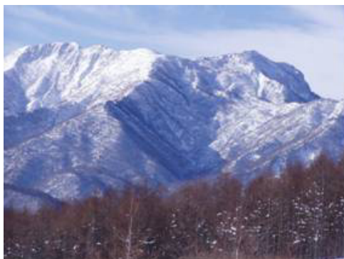
苗名小屋からの冬の妙高山