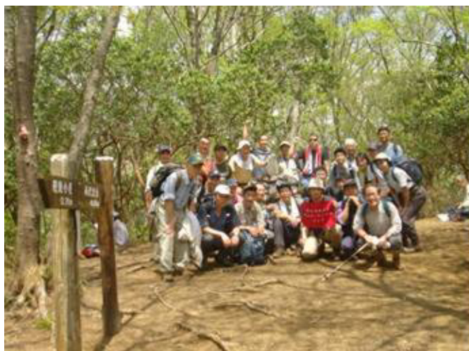
西丹沢・哇が丸山頂にて