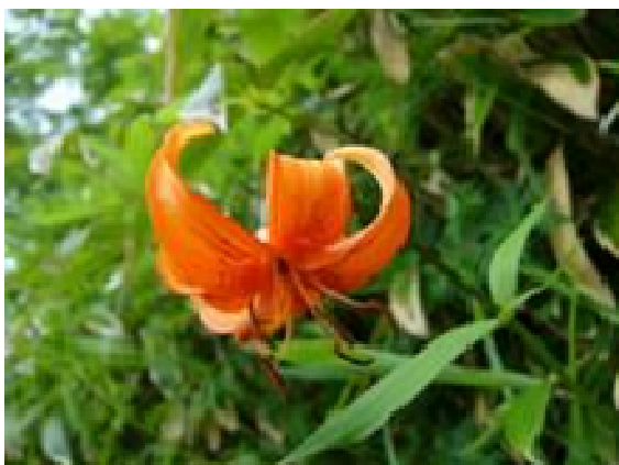
菅平・根子岳のクルマユリ

昨年より風力発電事業に携わることになり、横浜から長崎勤務となっています。長崎での生活も早1年を過ぎ、日常においてもゆとりをもって過ごせるようになってきました。今年のGWには宮之浦岳、6月にはミヤマキリシマが咲き誇る大船山にも登り、九州地方の山々を楽しんでいます。また、夏休みには由布岳と由布温泉を楽しむ予定にしています。