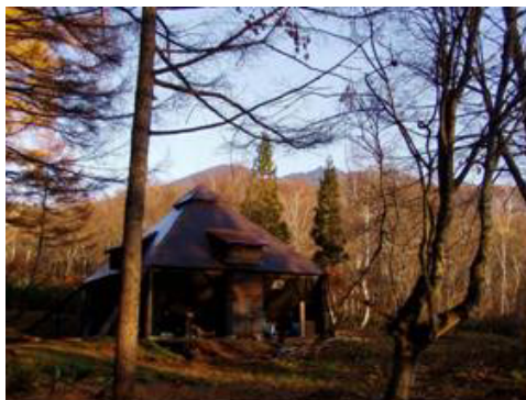
紅葉の朝の苗名小屋