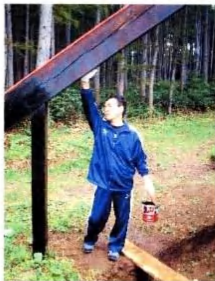
恒例 防腐剤塗りのひとコマ