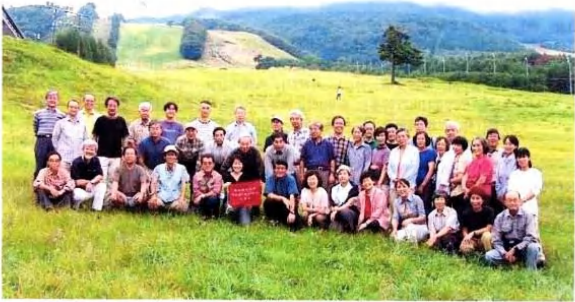
下山後の集合写真