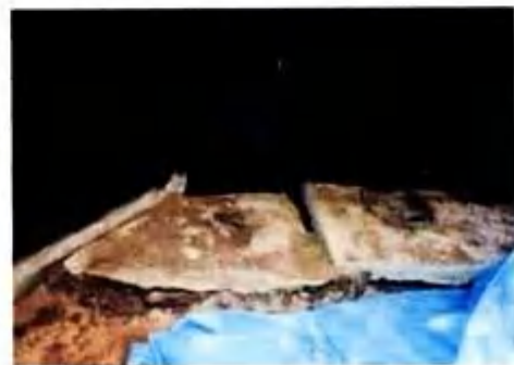
小屋外部便槽ふたの破損状況

そこで、平成 15 年度のトイレ補修は見送りとなりました。苗名小屋にふさわしいトイレのあり方を調査することが、平成 15 年 6 月の役員会で決まり、調査を引き受けさせて頂きました。