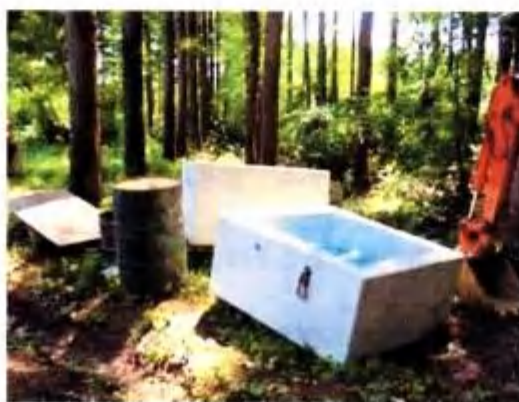
据付前の新しい便槽(8/28 撮影)